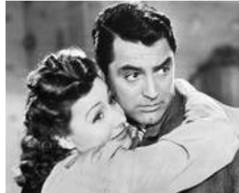
1940 MON ÉPOUSE FAVORITE (My favorite Wife) de Garson Kanin avec Cary Grant