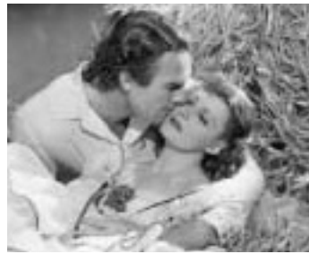
1937 LA FURIE DE L'OR NOIR (High, wide and Handsome) de R. Mamoulian avec R. Scott