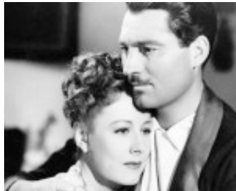
1944 LES BLANCHES FALAISES DE DOUVRES (The white cliffs of Dover) avec Alan Marshal