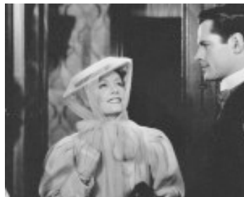
1934 UN SOIR EN SCÈNE (Sweet Adeline) de Mervyn Le Roy avec Donald Woods