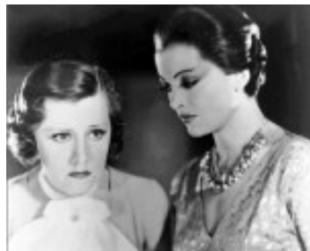
1932 HYPNOSE (Thirteen Women) de George Archainbaud avec Myrna Loy