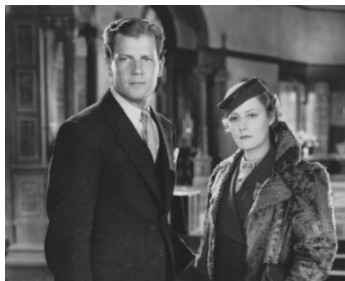
1933 THE SILVER CORD de John Cromwell avec Joel McCrea