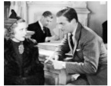
1938 QUELLE JOIE DE VIVRE (Joy of Living) de Tay Garnett avec Douglas Fairbanks Jr