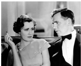
1933 ANN VICKERS (Ann Vickers) de John Cromwell avec Walter Huston