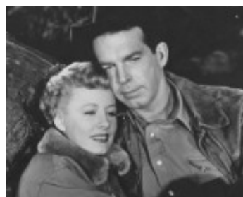
1950 MON COWBOY ADORÉ (Never a Dull Moment) de G. Marshall avec Fred MacMurray