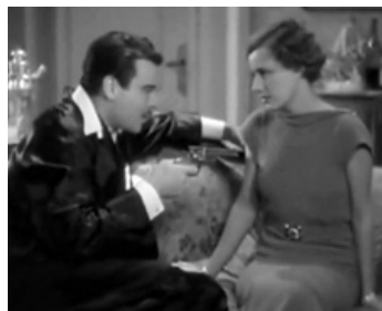
1933 IF I WERE FREE d'Elliott Nugent avec Nils Asther