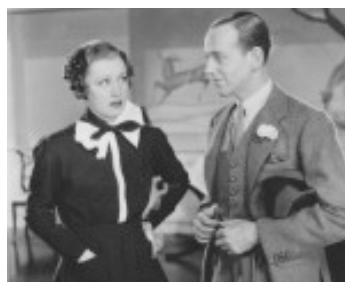
1935 ROBERTA (Roberta) de Mark Sandrich avec Fred Astaire