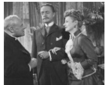
1947 MON PÈRE ET NOUS (Life with Father) de M. Curtiz avec E. Gwenn, William Powell