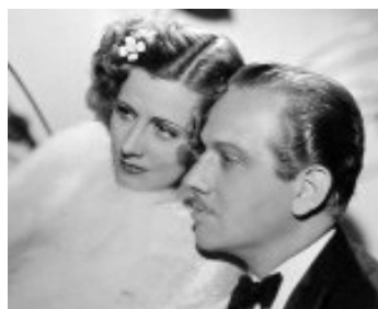
1936 THEODORA DEVIENT FOLLE (Theodora goes wild) de R. Boleslavsky avec M. Douglas