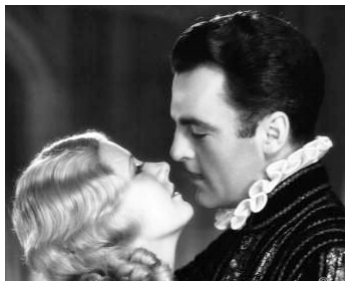
1931 LE GRAND AMOUR (The Great Lover) de Harry Beaumont avec Neil Hamilton