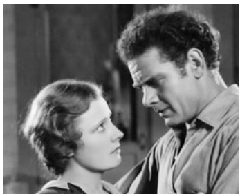
1933 NO OTHER WOMAN de J. Walter Ruben avec Charles Bickford