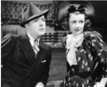
1939 VEILLÉE D'AMOUR (When tomorrow comes) de John M. Stahl