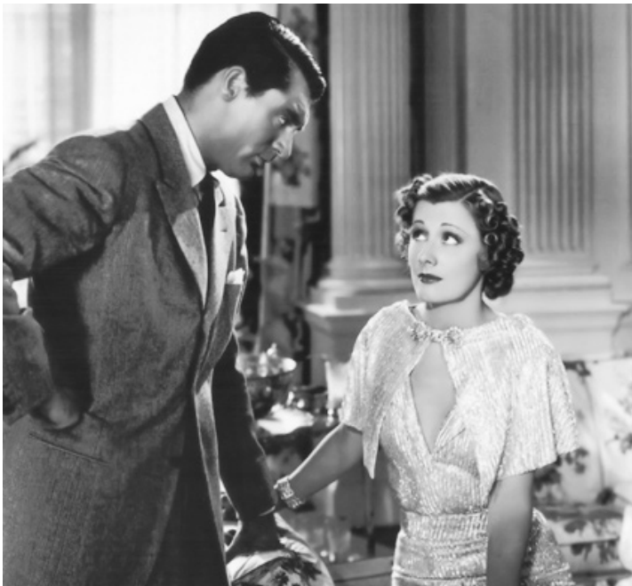
1937 CETTE SACRÉE VERITE (The awful Truth) de Leo McCarey avec Cary Grant