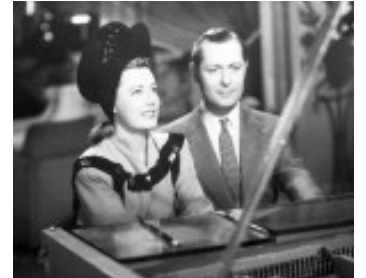
1941 UNFINISHED BUSINESS de Gregory La Cava avec Robertt Montgomery