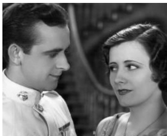
1930 PRÉSENTEZ ARMES (Leather Necking) d'Eddie Cline avec Eddie Foye