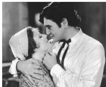
1931 LA RUÉE VERS L'OUEST (Cimarron) de Wesley Ruggles avec Richard Dix