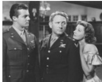
1943 UN NOMMÉ JOE (A Guy named Joe) de Victor Fleming avec Spencer Tracy