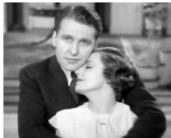
1934 THIS MAN IS MINE de John Cromwell avec Ralph Bellamy