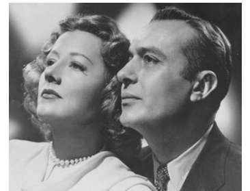
1944 COUP DE Foudre (Together again) de Charles Vidor avec Charles Boyer