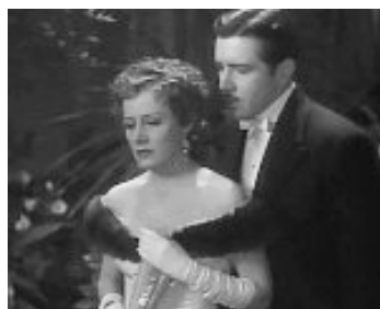
1934 L'ÂGE D'INNOCENCE (The Age of Innocence) de Philip Moeller avec John Boles