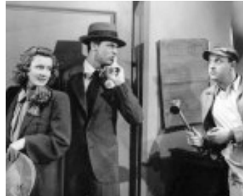
1941 LA CHANSON DU PASSÉ (Penny Serenade) de George Stevens avec Cary Grant