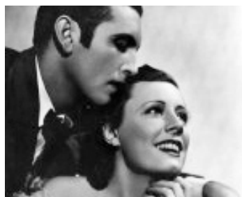
1936 LE THÉÂTRE FLOTTANT (Show Boat) de James Whale avec Allan Jones