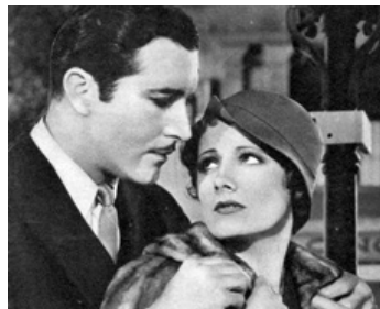
1932 BACK STREET (Back Street) de John M. Stahl avec John Boles