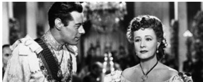
1946 ANNA ET LE ROI DE SIAM (Anna and the King of Siam) de John Cromwell avec Rex Harrison