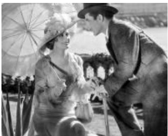
1933 THE SECRET OF MADAME BLANCHE de John Brahm avec Philip Holmes