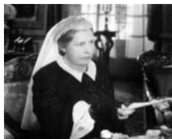
1950 LE MOINEAU DE LA TAMISE (The Mudlark) de Jean Negulesco