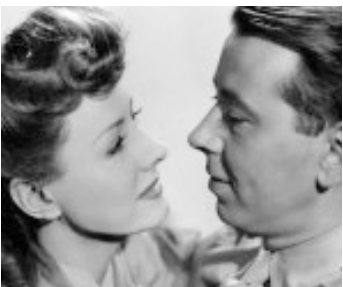
1945 OVER 21 de Charles Vidor avec Alexander Knox