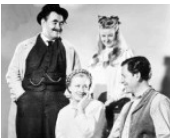
1948 TENDRESSE (I remember Mama) de George Stevens avec O. Homolka, B. Bel Geddes