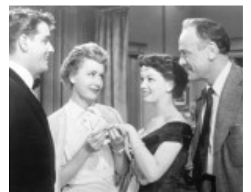
1952 ÇA POUSSE DANS LES ARBRES (It grows on Trees) d'A. Lubin avec R. Crenna, Joan Evans