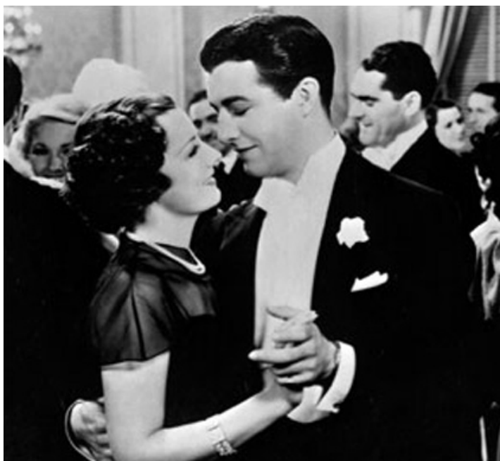
1935 LE SECRET MAGNIFIQUE (Magnificent Obsession) de John M. Stahl avec Robert Taylor