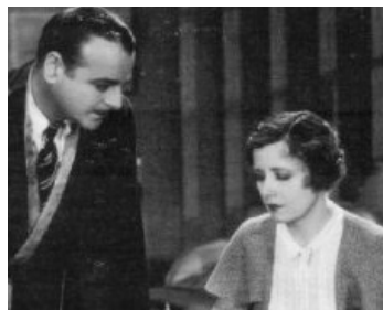
1931 BACHELOR APARTMENT de Lowell Sherman avec Lowell Sherman