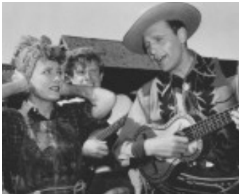
1942 LADY IN A JAM de Gregory La Cava avec Ralph Bellamy