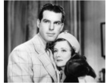
1938 INVITATION AU BONHEUR (invitation to Happiness) de W. Ruggles avec F. MacMurray