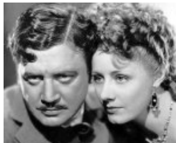
1934 STINGAREE de William Wellman avec Richard Dix