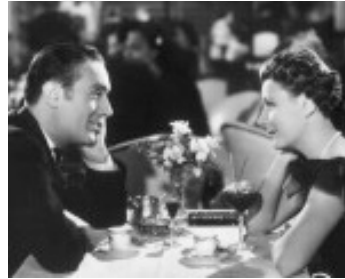
1938 ELLE ET LUI (Love Affair) de Leo McCarey avec Charles Boyer